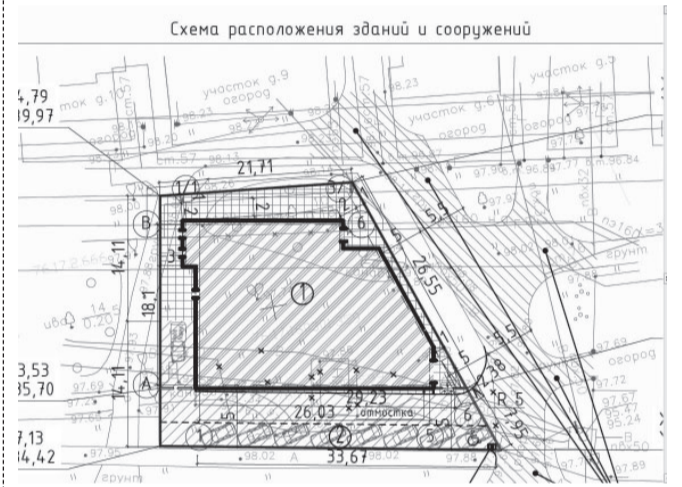
СХЕМА РАСПОЛОЖЕНИЯ ЗДАНИЯ НА ЗЕМЕЛЬНОМ УЧАСТКЕ С КАДАСТРОВЫМ НОМЕРОМ 76:17:160301:359

ПРИЛОЖЕНИЕ к постановлению Администрации ЯМР от 23.09.2020 № 1617