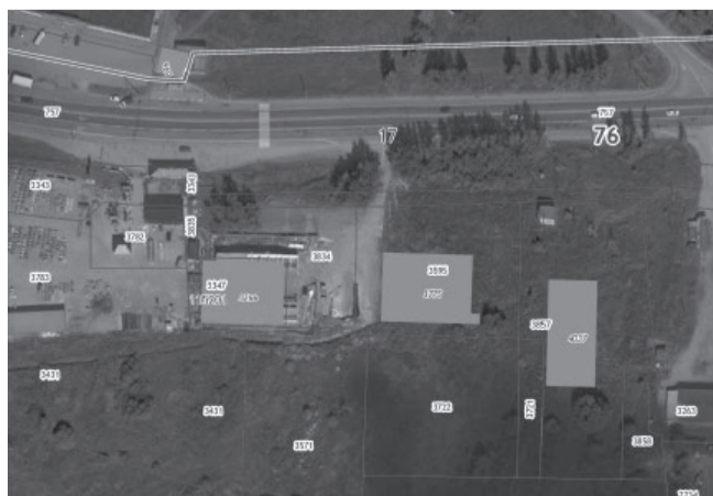
Схема границ территории планирования